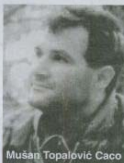
Mušan Topalović Caco

■ Genijalna je ona priča iz 1993. godine. Na koncert SCH na Obali došli su vojnici iz X brdske brigade, komandanta Mušana Topalovića Cace. Međutim, nisu ni vas ni publiku odveli na kopanje rovova, zato što su među bojovnicima bili i poštovaoci SCH.